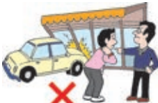
(自動車保険での支払いとなります)

(例) 自動車で集合場所へ行く途中、自動車事故を起こして賠償責任を負った場合は、支払われません。ただし、自分のケガに対しては、傷害保険が支払われます。