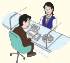
〈郵便局（ゆうちょ銀行）窓口〉

②加入依頼書に付属の払込取扱票を使用して、郵便局（ゆうちょ銀行）窓口で掛金を払込みください。