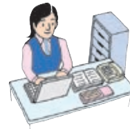
〈(財)スポーツ安全協会〉

②掛金と記入済みの加入依頼書（団体員名簿を含む。）を指定銀行窓口にご提出ください。加入依頼書③（代表者控）が返却されますので、大切に保管してください。